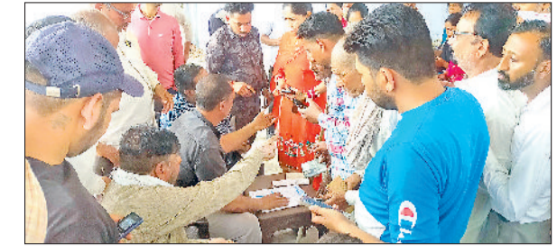
शहजादपुर। उपभोक्ताओं को गैस की उपलब्धता के लिए रसीद देते कर्मचारी।