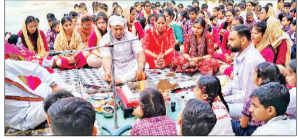
रादौर। हवन यज्ञ में भाग लेते बच्चे व स्टाफ सदस्य।