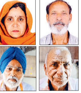
शहजादपुर। यात्रा से लौटा श्रद्धालुओं का जग्था अनुभव साझा करते श्रद्धालु।

अयोध्या धाम की पावन यात्रा पूरी कर विशेष ट्रेन लौटे श्रद्धालु बेहद खुश हैं। श्रद्धालुओं का कहना है कि यह यात्रा उनके जीवन की सबसे यादगार और आध्यात्मिक रूप से समृद्ध करने वाली रही। मुख्यमंत्री नायब सिंह सैनी और प्रदेश सरकार का आभार व्यक्त करते हुए ज्योदातर श्रद्धालुओं ने कहा कि 'हरियाणा मुख्यमंत्री तीर्थ यात्रा योजना' से जीवन का सपना साकार हो गया है। गौरतलब है कि 28 मार्च को मुख्यमंत्री नायब सिंह सैनी ने अंबाला छावनी रेलवे स्टेशन से अयोध्या धाम के लिए विशेष ट्रेन को हरी झंडी दिखाकर रवाना किया था। 31 मार्च को यह विशेष ट्रेन श्रद्धालुओं को लेकर वापस अंबाला