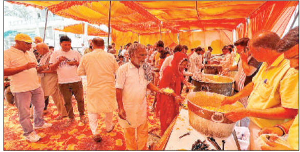
रादौर। भंडारे में प्रसाद ग्रहण करते श्रद्धालु।