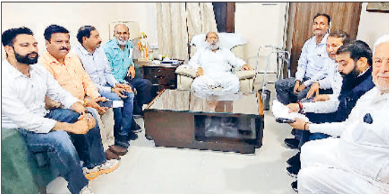
अंबाला। मीटिंग के दौरान मंत्री अनिल विज के साथ मौजूद भाजपा पदाधिकारी।

परिवहन एवं श्रम मंत्री श्री अनिल विज ने कहा कि भारतीय जनता पार्टी द्वारा पंडित दीनदयाल उपाध्याय प्रशिक्षण महाअभियान के अंतर्गत अंबाला छावनी में मंडल प्रशिक्षण कार्यशाला का आयोजन अग्रवाल धर्मशाला में 4 से 6 अप्रैल तक किया जाएगा। विज बुधवार को प्रशिक्षण कार्यशाला की तैयारियों को लेकर भाजपा मंडल प्रभारियों व मंडल