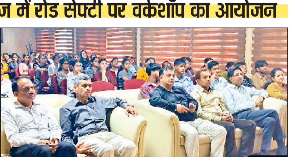
अंबाला। वर्कशॉप में हिस्सा लेते छात्र।